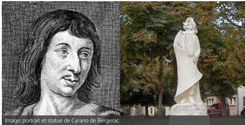
Image: portrait et statue de Cyrano de Bergerac