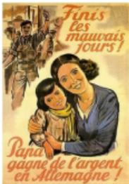
Une affiche de propagande du régime de Vichy (1943)

La milice, une organisation paramilitaire, est créée pour aider la Gestapo (la police allemande). Quelques français s'engagent même volontairement dans l'armée allemande.