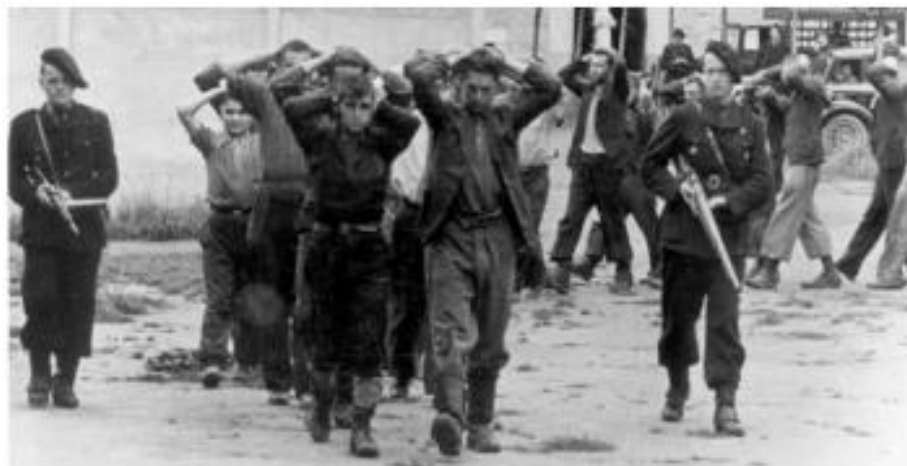
Des miliciens arrêtant des résistants.

→ Quelles mesures sont prises par les autorités françaises de Vichy, d'après ces deux derniers documents ?