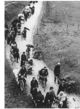
L'exode en mai/juin 1940