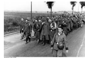
Colonne de soldats français prisonniers et conduits en Allemagne...