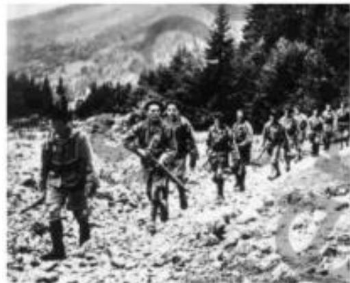
Résistants prenant le maquis de Haute Savoie