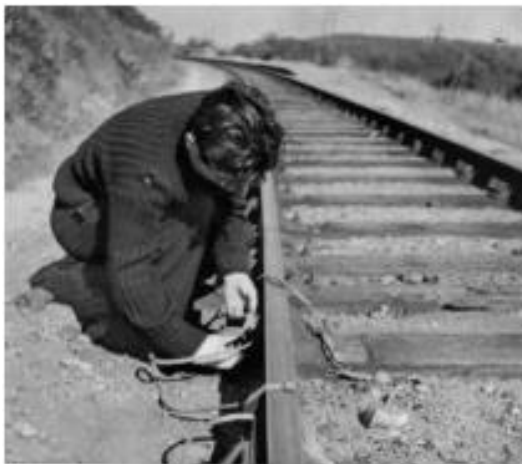
Un acte de sabotage des résistants

→ Quelle phrase de ce discours est un appel clair à résister à l'occupation allemande et à refuser la collaboration ?