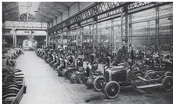
Chaîne de production usine Citroën En France