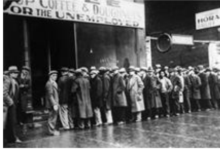
Les files d'attente de gens à la recherche d'un emploi deviennent très importantes

Cette crise se traduit essentiellement par une explosion du taux de chômage (1 500 000 chômeurs en 1935 en France). Des entreprises ferment, des gens sont ruinés, le mécontentement devient général.