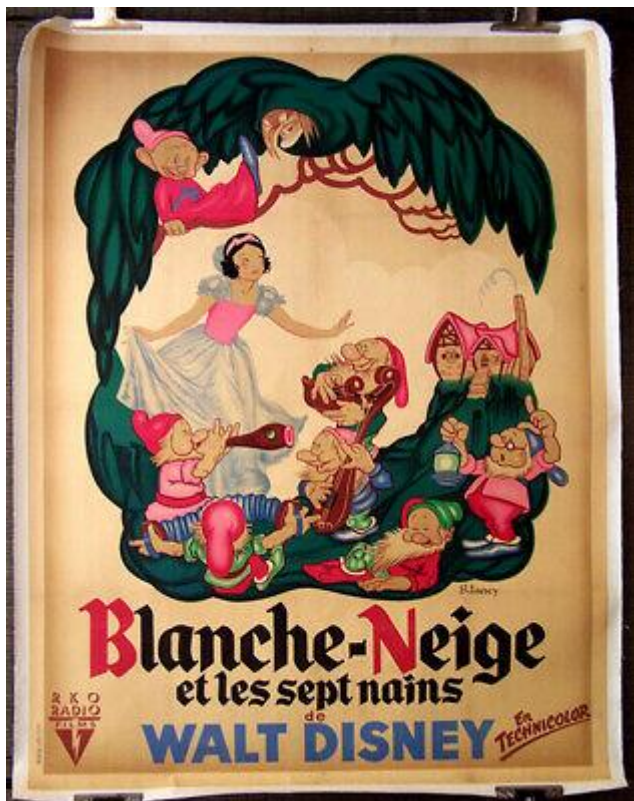
Le Film Blanche-Neige de 1937