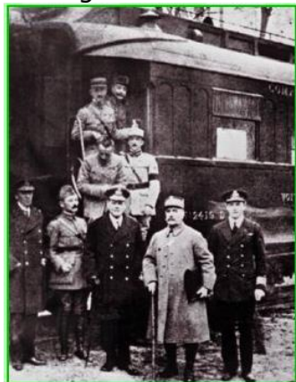
11 novembre 1918 : signature de l'armistice

Les Alliés font une percée victorieuse à partir de juillet 1918. Début novembre 1918, l'Allemagne, qui est en révolution, demande l'armistice. La signature de l'armistice du 11 Novembre 1918 à Rethondes (en forêt de Compiègne) marque la fin de la 1 ère Guerre Mondiale. A 6 heures du matin, les généraux allemands signent l'armistice avec les alliés. Dans le wagon-restaurant aménagé en salle de réunion, l'amiral Wemyss , le maréchal Foch et le général Maxime Weygand mettent fin à quatre ans de guerre. Le cessez-le-feu prend effet à 11 heures, dans toute la France, les cloches sonnent à la volée : la guerre est finie. Tous les combattants veulent croire que cette guerre est la " der des der ".