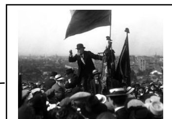
Jean Jaurès, assassiné le 31 juillet 1914...

Citoyens, jamais depuis 40 ans, l'Europe n'a été dans une situation plus tragique que celle où nous sommes à l'heure actuelle. Si l'Autriche envahit la Serbie, la Russie qui éprouve une sympathie profonde pour les Serbes entrera dans le conflit, et si la Russie intervient pour défendre la Serbie, l'Autriche au nom de l'alliance qui l'unit à l'Allemagne, prendra place sur les champs de bataille à ses côtés. Alors suivant le traité qui la lie à la France, la Russie demandera que la France vienne prendre place à ses côtés, et c'est l'Europe en feu, c'est le monde en feu.