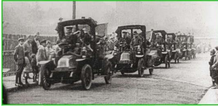
Septembre 1914 : les taxis de la Marne

Il y a plusieurs grandes batailles : la bataille de Verdun et la bataille de la Somme (1916) et le chemin des Dames (1917).