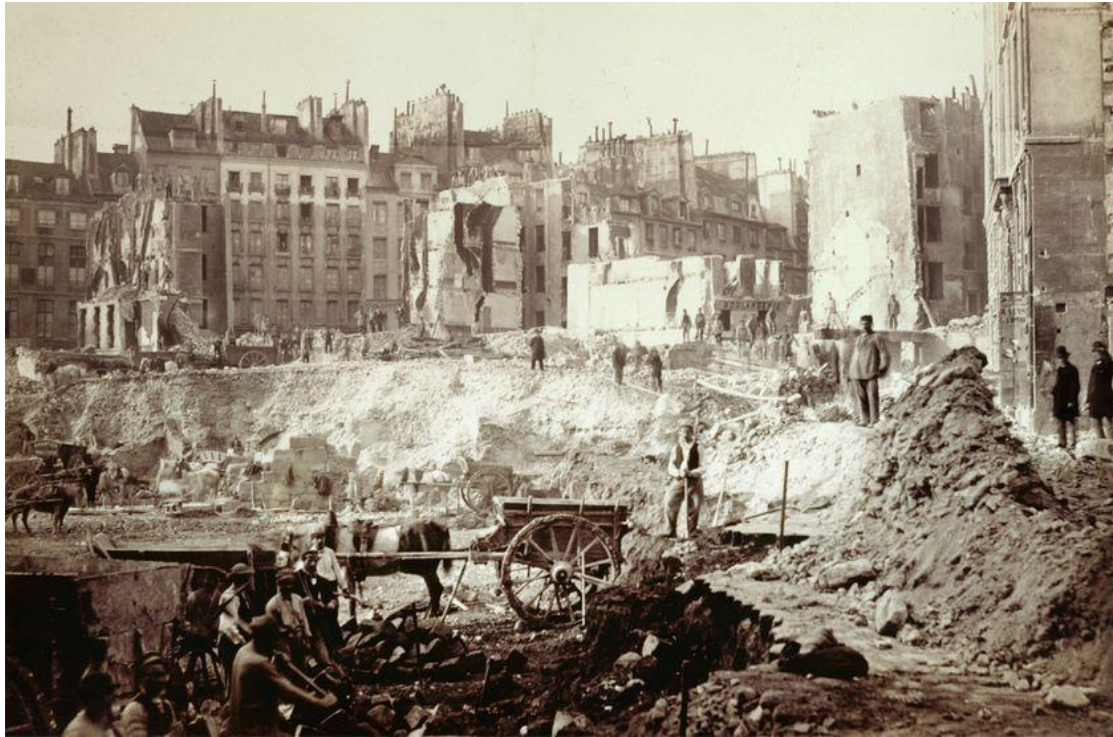
Chantier mené à Paris sous l'impulsion du préfet de Paris le baron Haussmann entre 1852 et 1870