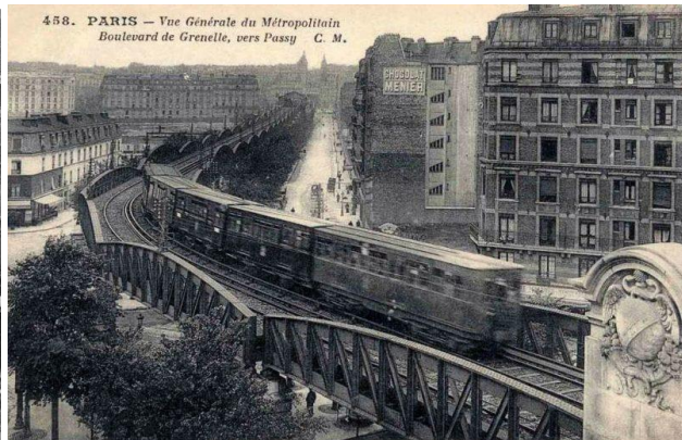
Chantier et premières utilisations du métropolitain de Paris dont la 1 ère ligne est inaugurée en 1900