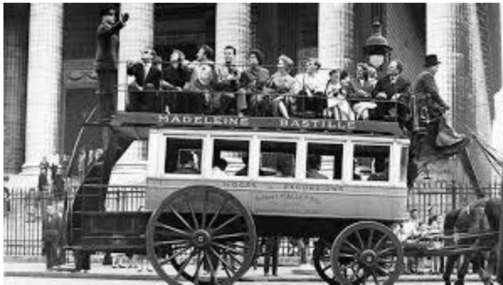
Transport public : omnibus à cheval