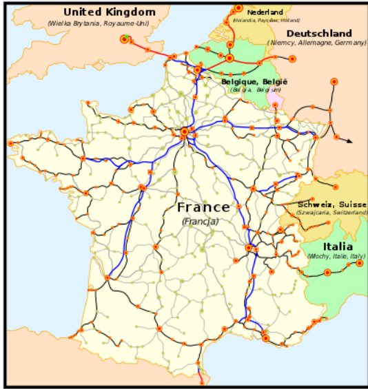
Le réseau TGV en juillet 2017 : en bleu et rouge : lignes à grande vitesse en bleu pointillé : lignes à grande vitesse actuellement en construction en noir : lignes classiques parcourues par les TGV.