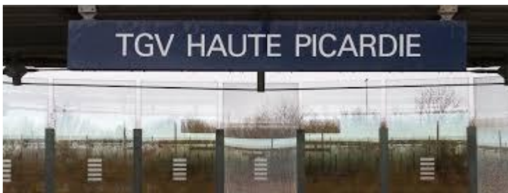
Gare près de Chaumes

Le TGV permet de relier les grandes villes françaises voire même d'autres villes en Europe.