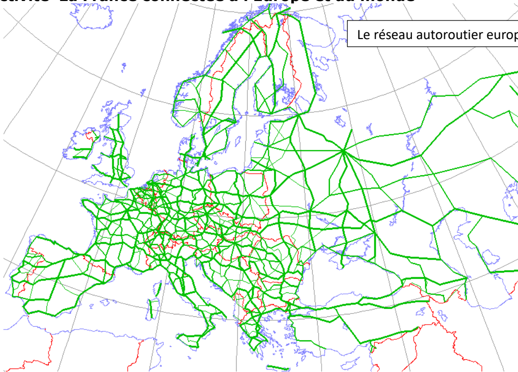
Le réseau autoroutier européen