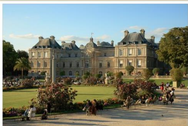
Palais du Luxembourg

À partir de 2011, un renouvellement par moitié est organisé tous les 3 ans. Les sénateurs siègent au Palais du Luxembourg .