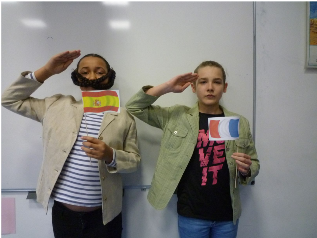
Le Commandeur espagnol et le Général français