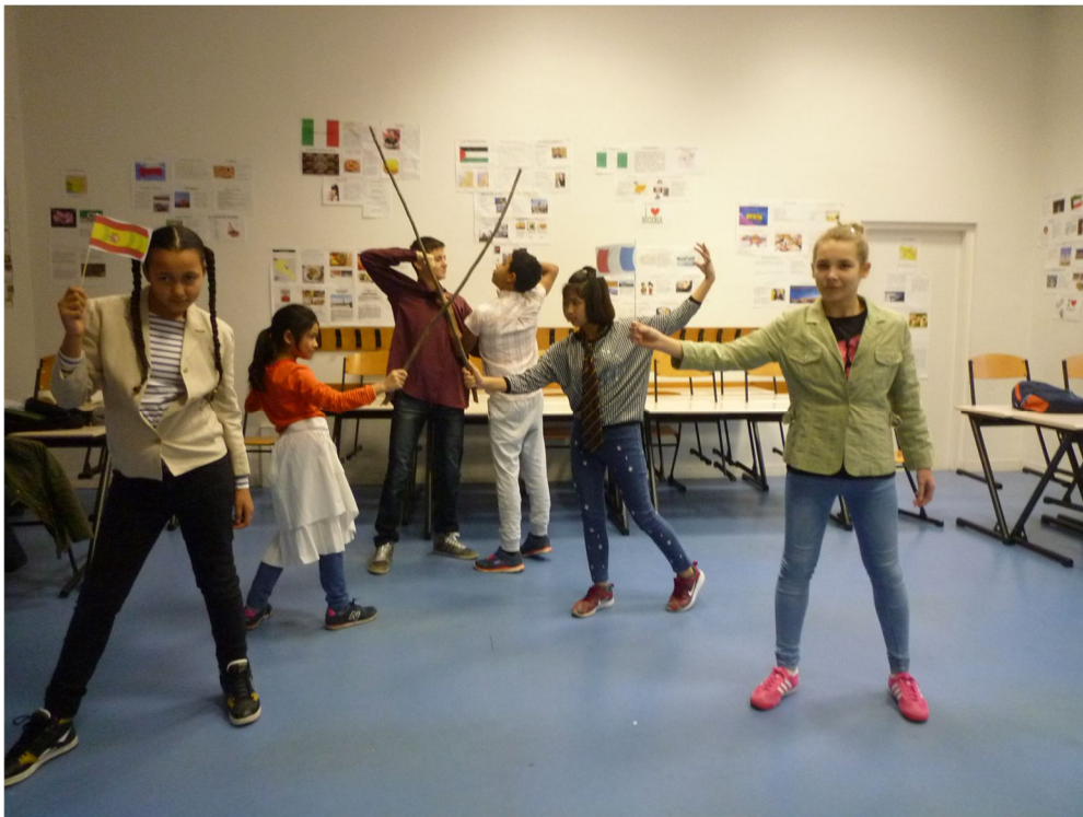
C'est la guerre entre les Français et les Espagnols.