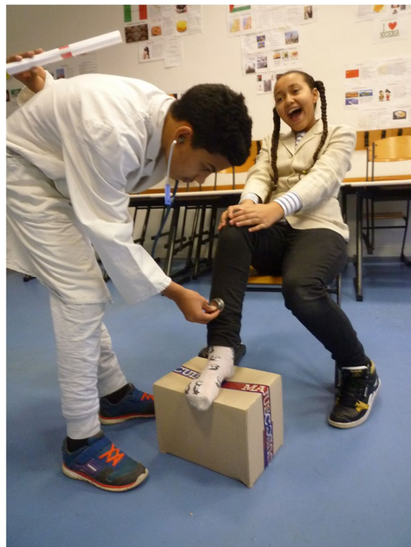
Armand vole la lettre rouge