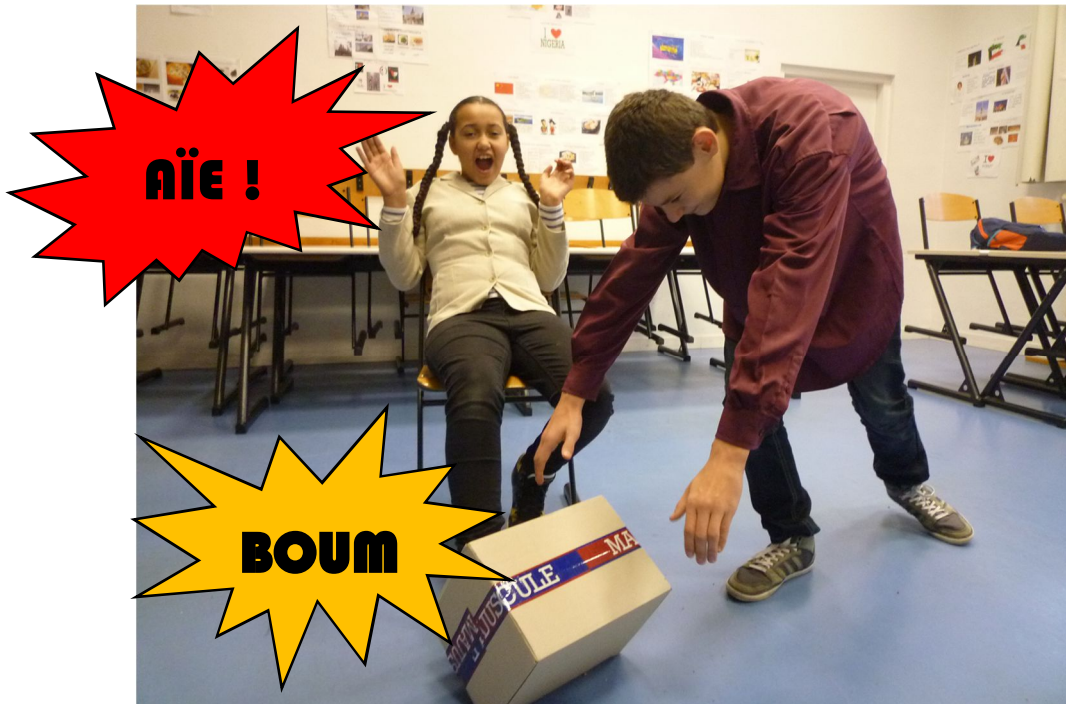
Lope fait tomber quelque chose sur le pied du Commandeur.