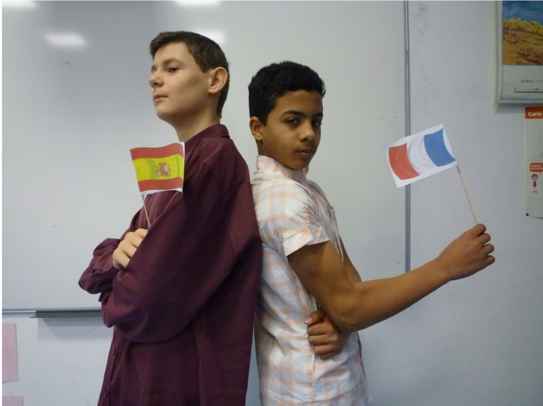
Le Loup espagnol et le Renard français