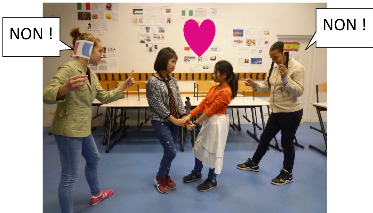
Le fils du Général français et la fille du Commandeur Espagnol s'aiment.