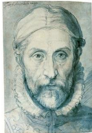
Artiste italien Né en 1527