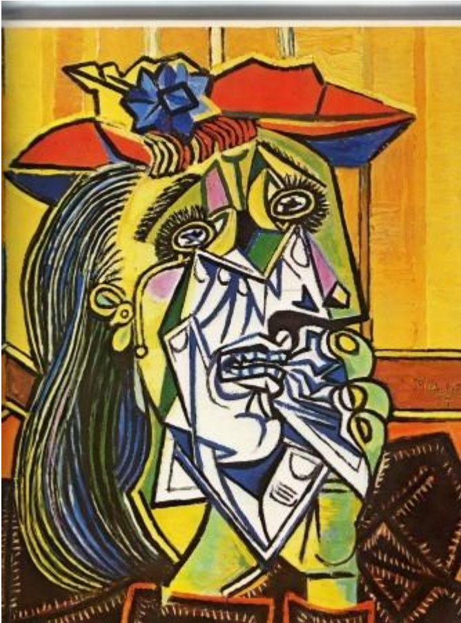
La femme qui pleure