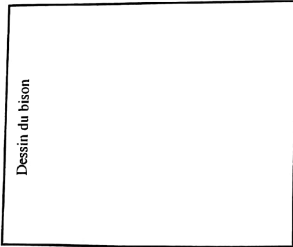
Dessin du bison