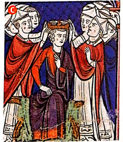
Détails de miniatures représentant le sacre de Louis IX, extraites de L'Ordre de la consécration et du couronnement des rois de France , vers 1280 (Bibliothèque nationale de France, Paris).