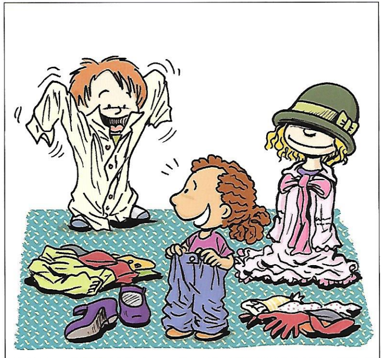
Constater que certains habits sont trop grands.