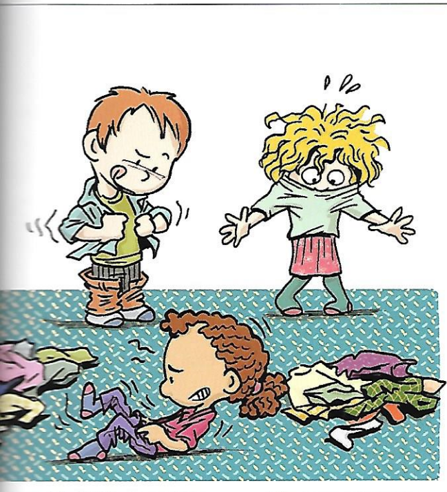
Constater que certains habits sont trop petits.