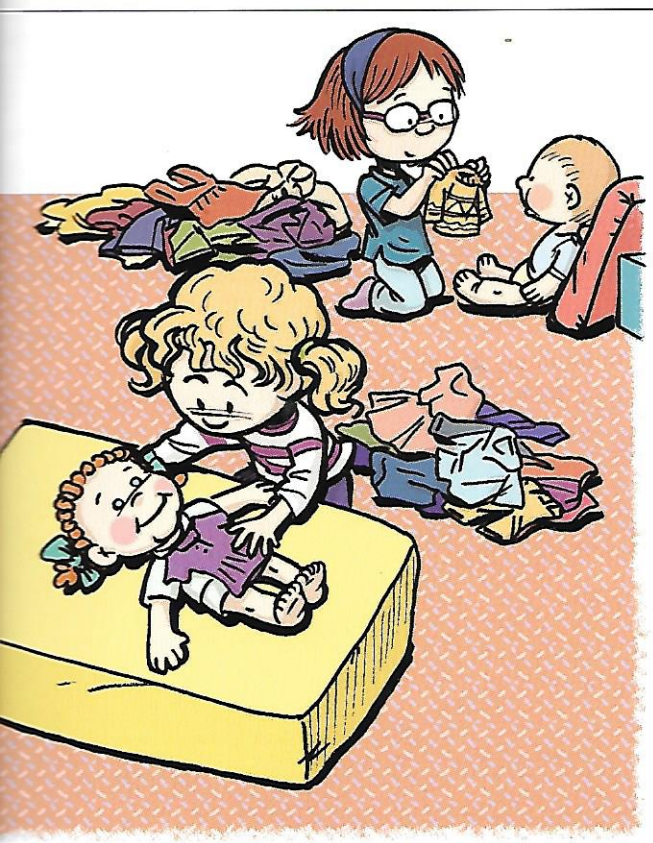
Essayer l'habit sur la poupée avant de l'habiller pour vérifier si l'habit correspond bien à la taille de la poupée.