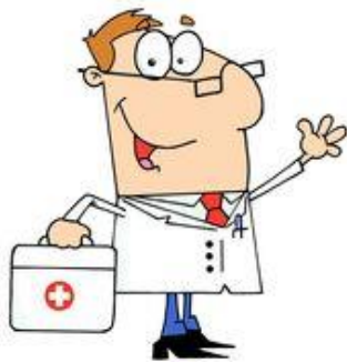
docteur ou médecin