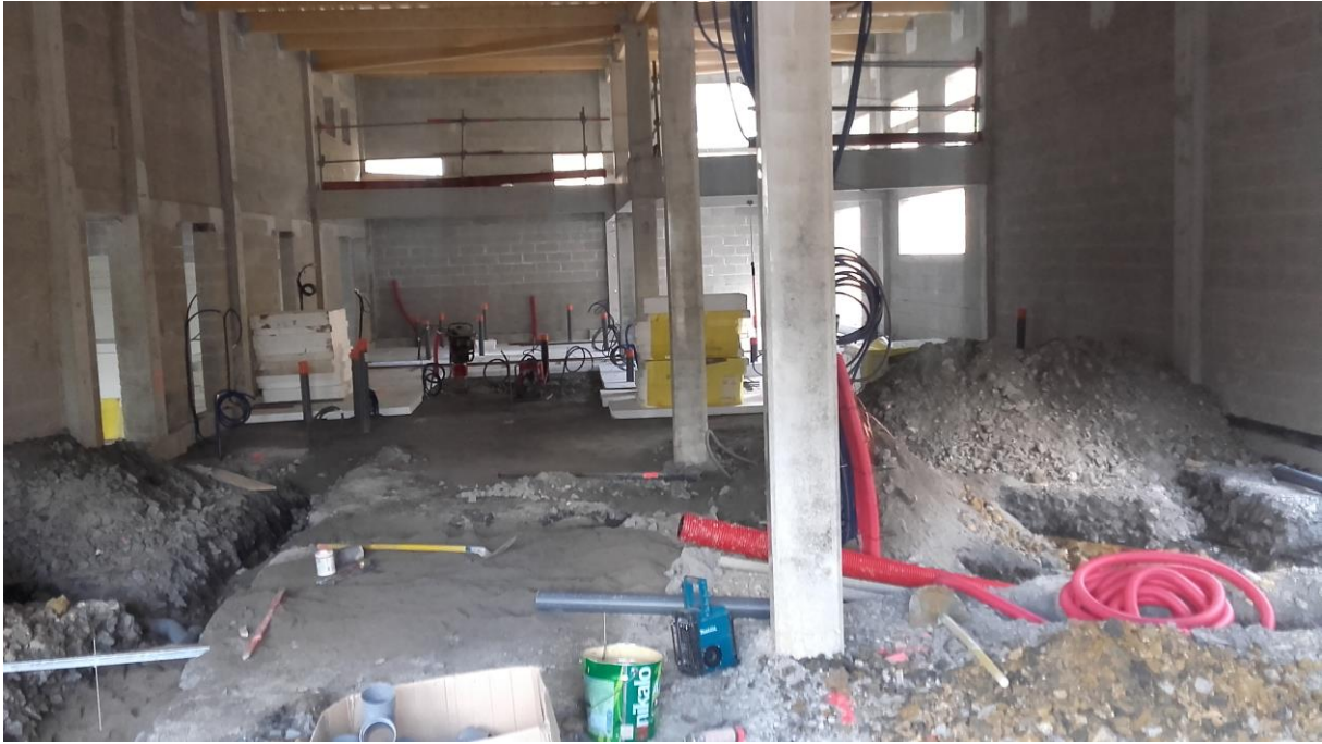
La zone de préparation des repas et de stockage. Avant la réalisation du sol, le passage des canalisations et du réseau électrique.