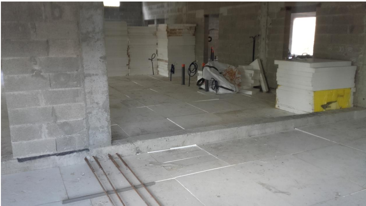
Pose de l'isolant sous la chape qui sera réalisée prochainement.