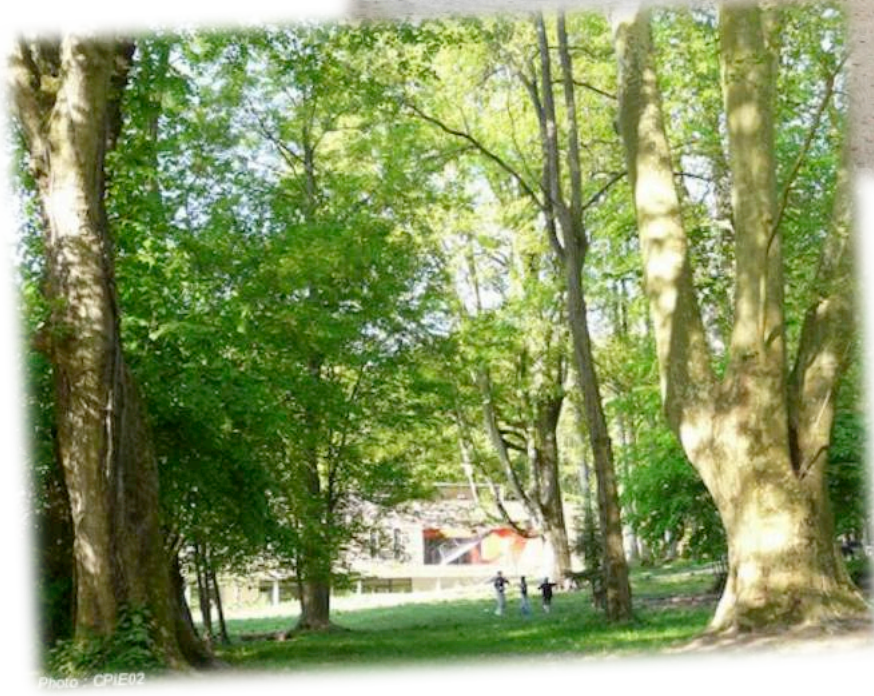
Photo - CPIE02