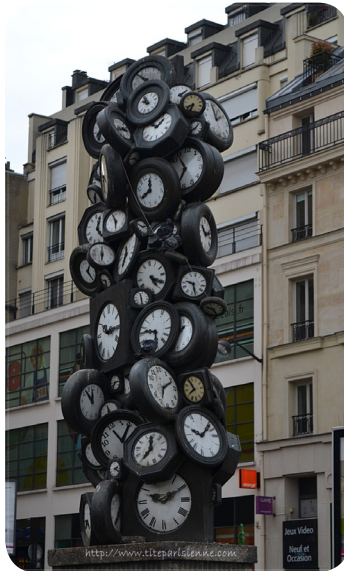
Arman, L'heure de tous, 1985