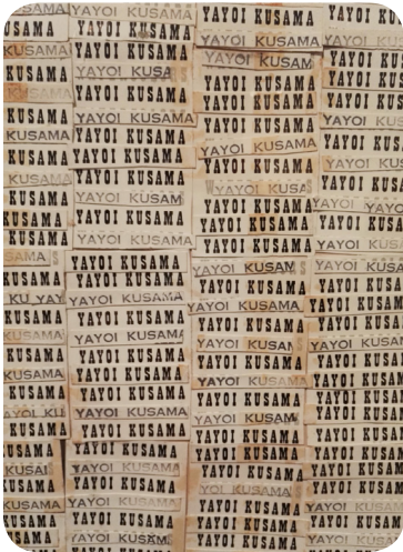
Yayoi Kusama, Accumulation of Letters, 1961

Une accumulation est une oeuvre d'art dans laquelle un objet est répété plusieurs fois pour composer un tableau ou un volume. Au 20ème siècle, de nombreux artistes ont utilisé l'accumulation dans leurs oeuvres, en collectionnant un objet et en le répétant plusieurs fois.