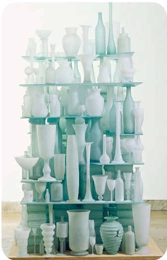
Tony Cragg, Eroded landscape, 1998