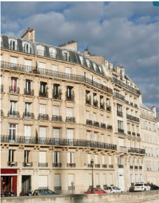
doc 1: un immeuble Haussmannien construit au XIXe siècle, Paris

employés sont logés sous les toits dans des conditions peu confortables. C'est le cas des immeubles haussmanniens construits à Paris à la fin du XIX e siècle sous l'impulsion du baron Haussmann, préfet de Paris.