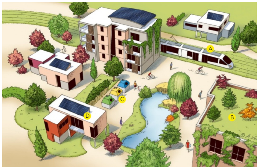
doc 4: modèle d'écoquartier

Les écoquartiers sont des programmes d'aménagement de la ville qui ont pour objectif de préserver la nature en économisant les ressources. Ils favorisent le bien-être des habitants, dans le respect de l'environnement.