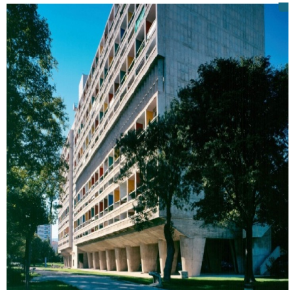
doc 3: La cité radieuse, 1951, Marseille Bouches-du-Rhone

Les bombardements de la Seconde Guerre mondiale ont détruit une partie de l'habitat de grandes villes de France. De nouveaux immeubles, plus élevés et avec plus de logements, sont construits dans les villes ou à leurs périphéries. Certains architectes, comme Le Corbusier, proposent des projets originaux, qui répondent au besoin de confort des habitants.