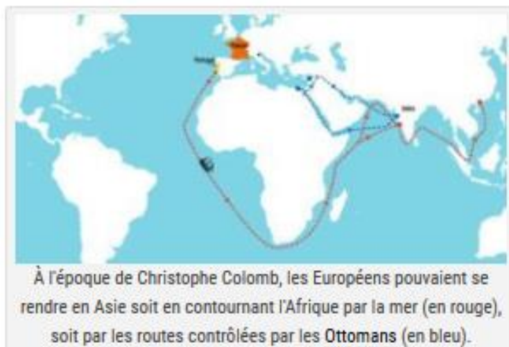
À l'époque de Christophe Colomb, les Européens pouvaient se rendre en Asie soit en contournant l'Afrique par la mer (en rouge), soit par les routes contrôlées par les Ottomans (en bleu).

Cristoforo Colombo , qu'on appelle en français Christophe Colomb, serait né à Gênes, en Italie, en 1451 . Passionné de voyages, il s'installe au Portugal à l'âge de 25 ans. Il fait de nombreux voyages maritimes et apprend les sciences de la navigation.