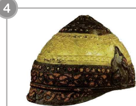
Casque gaulois en bronze, or, émail et fer, III e s. av. J.-C.

Textes issus de Histoire-Géographie CE2 (Hachette)