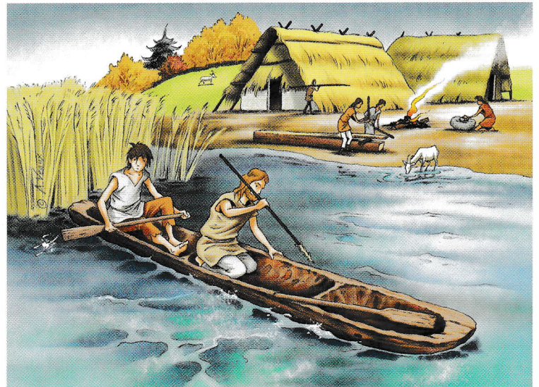
Doc 4 Le déplacement en pirogue

À la fin de la préhistoire, les hommes deviennent sédentaires et s'établissent dans des campements fixes. Ils choisissent souvent de s'installer près des lacs ou des rivières. Ils inventent alors la pirogue pour se déplacer sur l'eau et pratiquer la pêche de manière efficace.