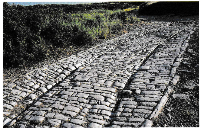
Doc 3 Une voie romaine aujourd'hui à Viviers (Ardèche)

Comme l'Empire romain est très étendu, les Romains construisent un long réseau de routes pavées pour faciliter les communications et les échanges de marchandises. Celui-ci permet aussi aux armées de se déplacer facilement à l'intérieur de l'Empire pour garantir la sécurité du territoire. Aujourd'hui, certaines de ces voies existent encore.