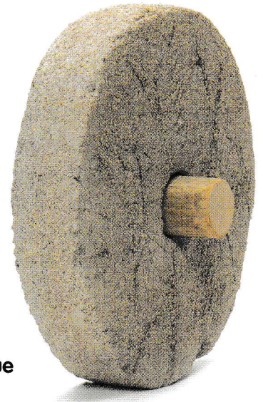
Doc 2 Une roue antique