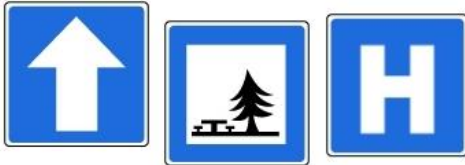
circulation à sens unique emplacement pour pique-nique hôpital