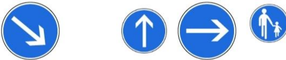
obligation de contourner l'obstacle obligation d'aller tout droit direction obligatoire : tout droit chemin pour piétons