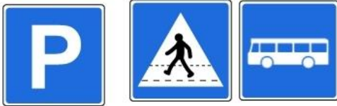
parc de stationnement passage piétons arrêt d'autobus