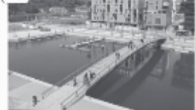
Quartier de la Confluence à Lyon