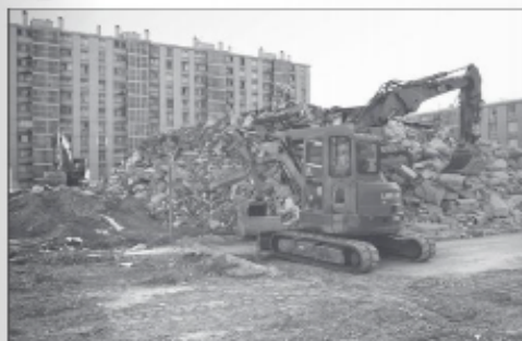
La démolition de la tour H en 2014

2 Observe cette photo, ce plan et lis ce texte sur le quartier du Petit Bard à Montpellier.