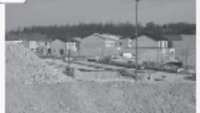
Ville de Saint-Priest, banlieue de Lyon

a. Classe chaque photo dans le tableau ci-dessous en mettant une croix correspondante.