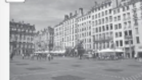
Place des Terreaux, centre historique de Lyon