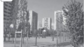
Quartier des Minguettes à Vénissieux, banlieue de Lyon