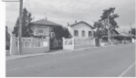
Ville de Décines-Charpieu, banlieue de Lyon