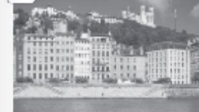
Bord de Saône, centre-ville de Lyon