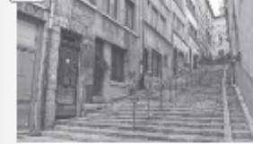
Montée du Garillan, centre historique de Lyon