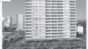
Quartier de la Duchère à Lyon