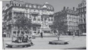
Place des Jacobins à Lyon