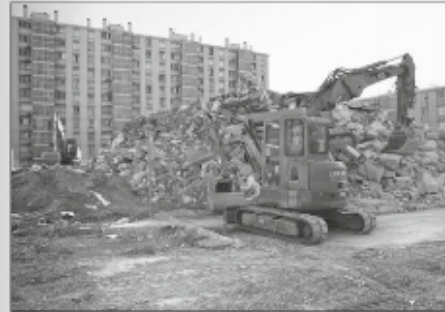
La démolition de la tour H en 2014