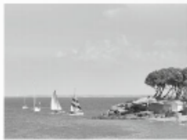
Une station balnéaire