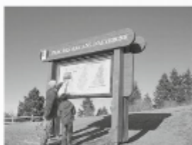
Un parc naturel