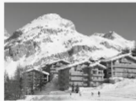
Une station de ski