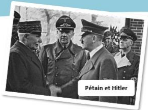
Pétain et Hitler

La France perd la guerre et finit par capituler. Le général Pétain demande un armistice aux Allemands en juin 1940 et propose de collaborer avec eux. Les Allemands s'installent donc en France et prennent le commandement du pays.