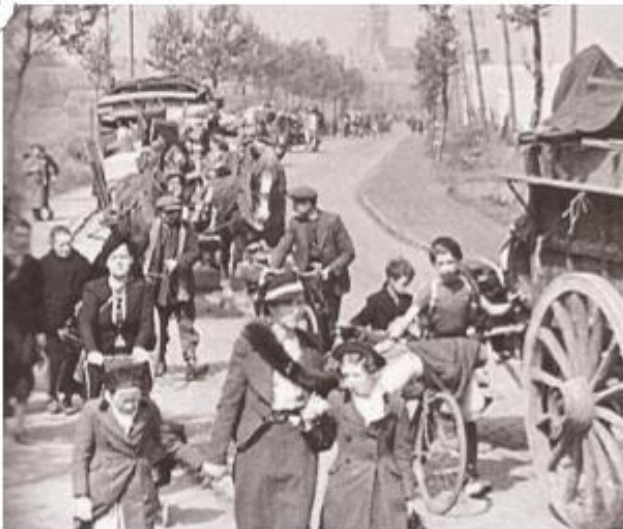
L'exode en France (civils qui fuient le Nord-Pas-de-Calais pour échapper à l'armée allemande, mai 1940)

En mai-juin 1940, l'armée allemande avance rapidement sur le territoire français. De nombreux civils fuient. L'armée française est vaincue en 5 semaines.