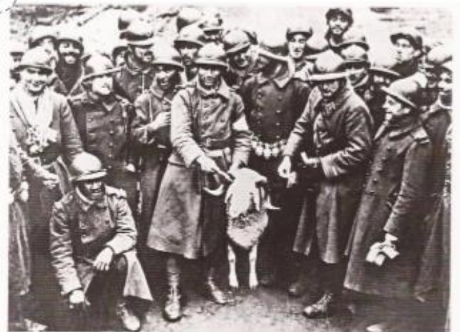
Une unité de tirailleurs sénégalais pendant la guerre