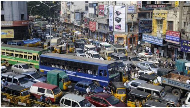
Doc. 1 : Scène d'embouteillage à Mumbai

En pleine heure de pointe à Mumbai, il est au moins aussi difficile de monter à bord d'un train que de se trouver une place assise dans une mêlée de rugby. Les portières ne se ferment jamais. D'ailleurs, elles n'existent même plus. Dix à douze passagers périssent chaque jour. Certains grimpent sur les toits et meurent électrocutés, d'autres tombent des compartiments surchargés et, enfin, ceux qui traversent une voie de chemin de fer finissent parfois écrasés.