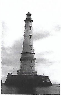
Le phare de Cordouan