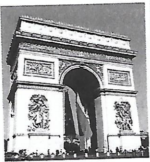
L'arc de triomphe

8 PROBLÈME Voici le nombre de marches de trois monuments français.