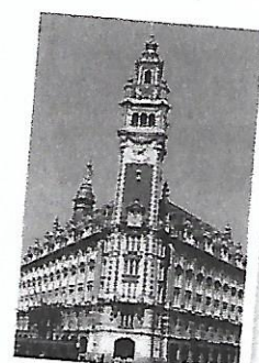
Le beffroi de Lille