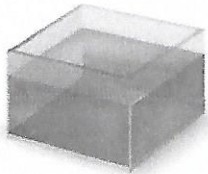
un aquarium rempli d'eau