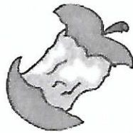
un trognon de pomme