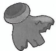
un morceau de verre