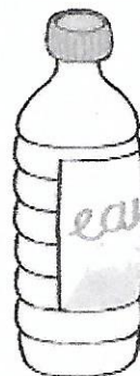
une bouteille en plastique