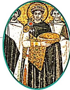
Mosaïque, VI e siècle.