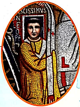
Mosaïque, VIII e siècle.

Constantinople, à la tête de l'Église byzantine. Alors qu'à la fin du VIII e siècle, l'autorité du pape Léon III est remise en cause au sein même de la communauté catholique, Charlemagne intervient pour l'aider à restaurer son pouvoir. Le pape voit alors en Charlemagne un allié fidèle et puissant.