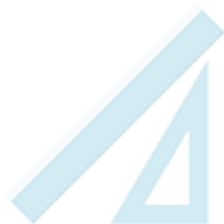
une règle 30cm et une équerre