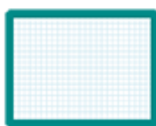
une ardoise blanche