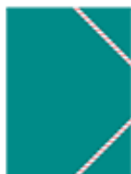
une pochette à rabats