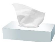
2 boîtes de mouchoirs

Il est préférable de prévoir du matériel de rechange à la maison afin de pouvoir le renouveler dans l'année et de vérifier souvent le contenu de la trousse.