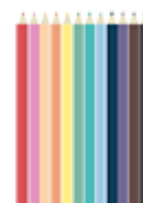
12 crayons de couleur