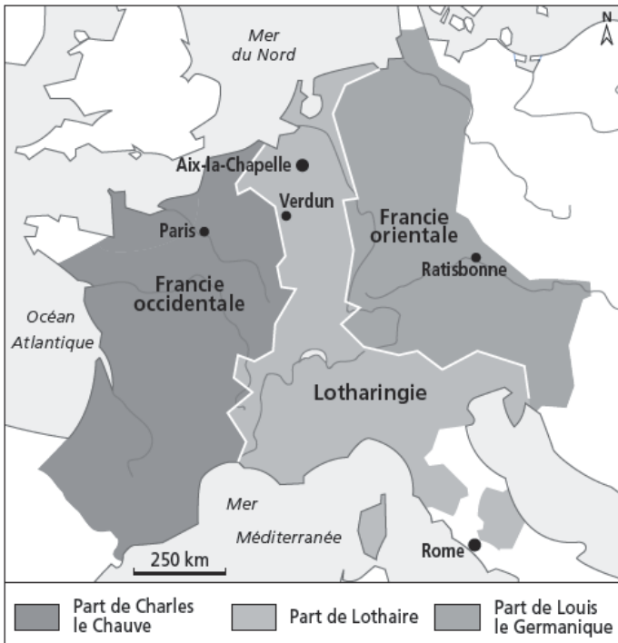
Doc. 1 Le traité de Verdun : le partage de l'Empire à la mort de Charlemagne en 843 entre ses trois petits-fils : Charles, Lothaire et Louis.

Je découvre la fin de la dynastie carolingienne.